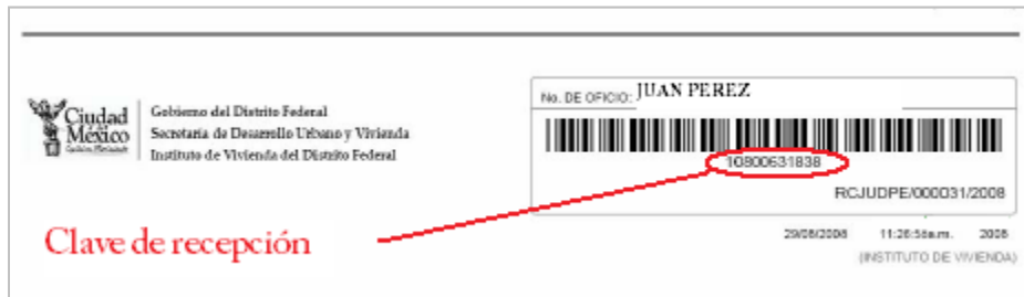
Fig. 1.1 Acuse digital con código de 11 dígitos que la Oficialía de Partes entrega al Solicitante.

1. Impresión de acuse digital que Oficialía de Partes entrega al solicitante fig. 1.1, con una clave de recepción de 11 dígitos.